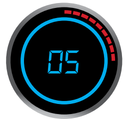
25%: Indicating lights in red