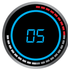
75%: Indicating lights in grey