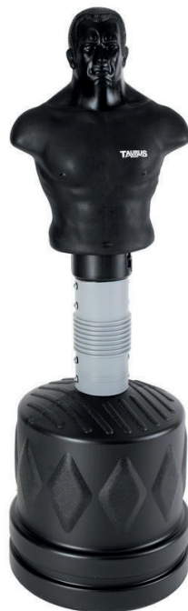
Art. No. TB-3200