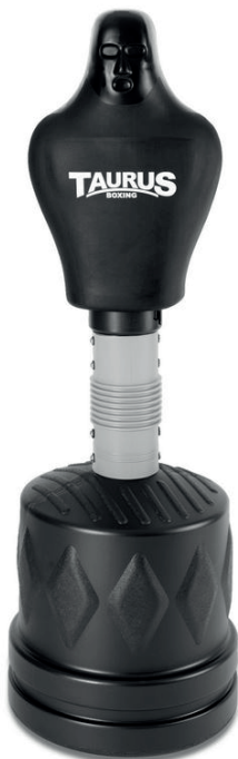
Art. No. TB-3000